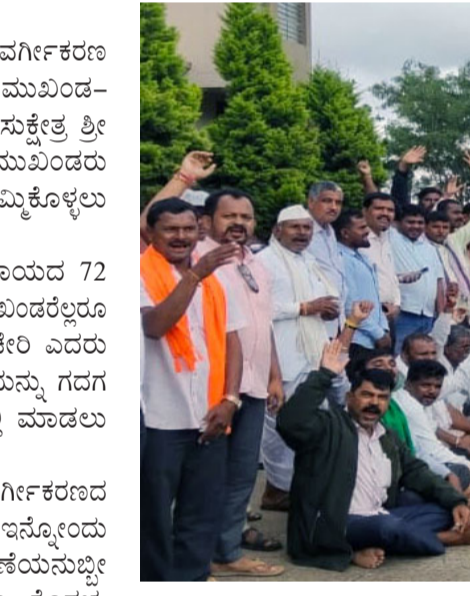
ಕೈಬಿಡುವುದಿಲ್ಲ ಎಂದು ರಾಜ್ಯ ಸರ್ಕಾರಕ್ಕೆ ಎಚ್ಚರಿಕೆಯ ಸಂದೇಶ ನೀಡಿದರು.

□ ಸೈಹಜೀವಿ ನ್ಯೂಸ್ ಗದಗ, ಸೆ. 29 : ಅವೈಜ್ಞಾನಿಕ ಒಳ ಮೀಸಲಾತಿ ವರ್ಗೀಕರಣ ವಿರೋಧಿಸಿ ಗದಗ ಜಿಲ್ಲಾ ಬಂಜಾರ ಸಮುದಾಯದ ಮುಖಂಡರಿಂದ ರವಿವಾರ ಗದಗ ತಾಲೂಕಿನ ನಾಗಾವಿಯ ಸುಕ್ಷೇತ್ರ ಶ್ರೀ ರೇಣುಕಾದೇವಿ ಯಲ್ಲಮ್ಮ ದೇವಸ್ಥಾನದಲ್ಲಿ ಜಿಲ್ಲೆಯ ಮುಖಂಡರು ಹೋರಾಟದ ಕುರಿತು ರೂಪರೇಷಗಳನ್ನು ಹಮ್ಮಿಕೊಳ್ಳಲು ಪೂರ್ವಭಾವಿ ಸಭೆ ಜರುಗಿತು. ಸಭೆಯಲ್ಲಿ ಗದಗ ಜಿಲ್ಲೆಯ ಬಂಜಾರ ಸಮುದಾಯದ 72 ತಂಡಗಳ ನಾಯಕ, ಡಾವ್, ಕಾರಭಾರಿ ಮತ್ತು ಮುಖಂಡರೆಲ್ಲರೂ ಸೇರಿ ಅಕ್ಟೋಬರ್ 6 ರಿಂದ ಗದಗ ಜಿಲ್ಲಾದಳಿತ ಕಚೇರಿ ಎದುರು ಬೃಹತ್ ಪ್ರತಿಭಟನೆಯೊಂದಿಗೆ ಅಹೋರಾತ್ರಿ ಧರಣಿಯನ್ನು ಗದಗ ಜಿಲ್ಲಾಧಿಕಾರಿಗಳ ಕಾರ್ಯಾಲಯದ ಮುಂಭಾಗದಲ್ಲಿ ಮಾಡಲು ತೀರ್ಮಾನಿಸಿದರು. ರಾಜ್ಯ ಸರ್ಕಾರದ ಒಳಮೀಸಲಾತಿ ಅವೈಜ್ಞಾನಿಕ ವರ್ಗೀಕರಣದ ತಾರತಮ್ಯ ನೀತಿ ಮತ್ತು ಒಂದು ಸಮುದಾಯಕ್ಕೆ ಬಣ್ಣ ಇನ್ನೊಂದು ಸಮುದಾಯಕ್ಕೆ ಬಣ್ಣ ಎನ್ನುವ ಇಬ್ಬಗೆಯ ಧೋರಣೆಯನ್ನು ಭೇದಿಸುವುದೇ ಸಂದರ್ಭದಲ್ಲಿ ಖಂಡಿಸಿದರು. ಬಂಜಾರ, ಕೊರಮ, ಕೊರಚ, ಭೋಮಿ ಜಾತಿಗಳಿಗೆ ರಾಜ್ಯ ಸರ್ಕಾರವು ಅನ್ಯಾಯ ವೇಸಗಿದೆ. ಒಳಮೀಸಲಾತಿಯ ವರ್ಗೀಕರಣದಲ್ಲಿ ನಮ್ಮ ಸಮುದಾಯಗಳಿಗೆ ಸಂಪೂರ್ಣವಾಗಿ ನ್ಯಾಯ ಸಿಗುವವರೆಗೆ ಹೋರಾಟವನ್ನು