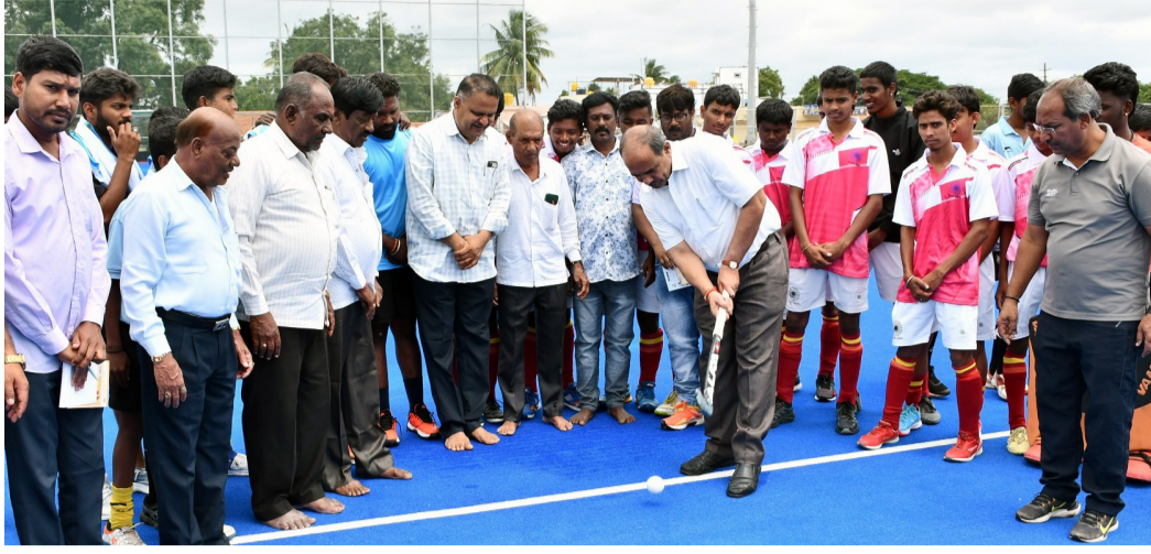
ಬೆಟಗೇರಿಯಲ್ಲಿ 4 ತಂಡಗಳಿಂದ ಮೂರು ಪಂದ್ಯಗಳು ನಡೆಯಲಿವೆ.